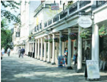
Die Pantiles, Tunbridge Wells

Heart of Kent heißt mit seiner großen Auswahl an freundlichen B&Bs, Gästehäusern, Pensionen und Hotels alle Besucher herzlich willkommen. Die ländliche Umgebung mit schönen Dörfern, Country Pubs, Hopfenfeldern und Weinbergen macht Heart of Kent zu einem idealen Urlaubsziel.