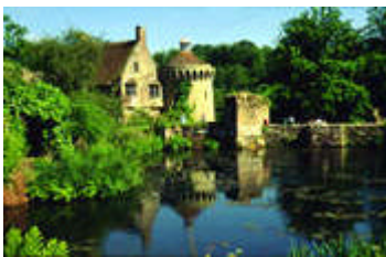
Scotney Castle Garden

Heart of Kent ist englische Landschaft vom Feinsten. Eine Landschaft mit welligen Hügeln und bewaldeten Tälern, Obstgärten und Weinbergen, herrlichen Schlössern, Gärten und vielen historischen Häusern. Hier stehen mehr Schlösser, herrschaftliche Häuser und Gärten der Öffentlichkeit offen als anderswo in Großbritannien. So liegt z.B. Tonbridge Castle an einem schönen Fluss, die Stadt bewachend, während sich das bekannte Leeds Castle von zwei Inseln in einem See inmitten eines von Capability Brown gestalteten Parks erhebt. Für die Gartenliebhaber bilden die Ruinen eines von einem Wassergraben umgebenen Schlosses aus dem 14. Jh. den Hintergrund für einen der romantischsten Gärten Englands, Scotney Castle Garden.