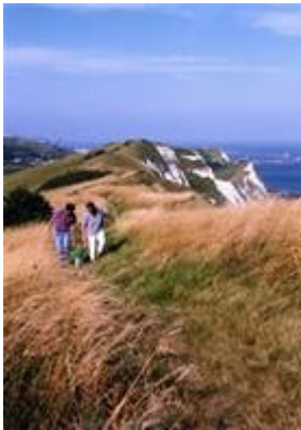
Die Kreidefelsen von Dover

Im geschichtlich bedeutsamen Küstenbereich findet man viele traditionelle Seebäder wie zum Beispiel Ramsgate und Folkestone, die noch ihre viktorianische Eleganz präsentieren. Hier kann man sich am Strand entspannen oder an den Kreidefelsen Dovers die tolle Aussicht bis hinüber nach Frankreich genießen!