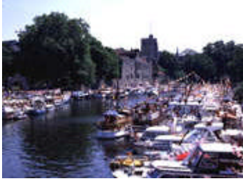
Maidstone River Festival

Heart of Kent heißt mit seiner großen Auswahl an freundlichen B&Bs, Gästehäusern, Pensionen und Hotels alle Besucher herzlich willkommen. Die ländliche Umgebung mit schönen Dörfern, Country Pubs, Hopfenfeldern und Weinbergen macht Heart of Kent zu einem idealen Urlaubsziel.